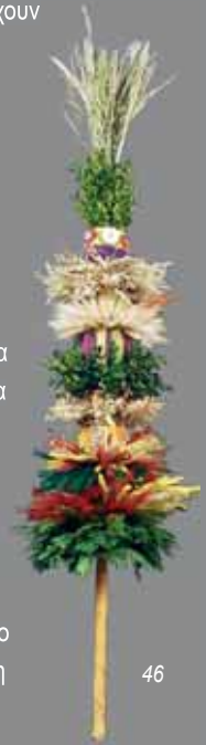
46. Πασχαλιάτικα Βάγια, κατασκευή A. Małkowska, A. Kapel, M. Mazurek-Cierniak, R. Leja (Δίκτυο Σχολείων στο Oleszyce, Lubaczów), 2008, Πολωνία