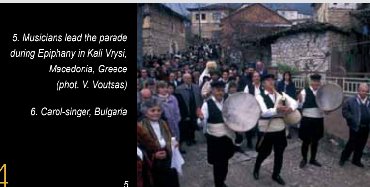
5. Musicians lead the parade during Epiphany in Kali Vrysi, Macedonia, Greece