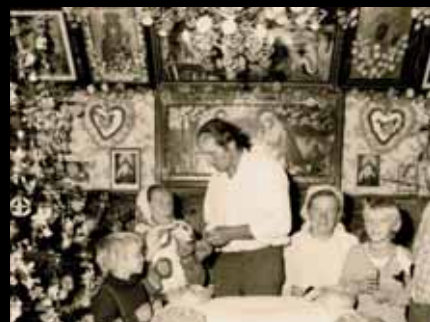
30. Sharing “oplatek” during the Christmas eve dinner. Tokarnia, Małopolskie voivodship, phot. J. Kubiena, 1992, Poland

Christmas Eve, known also as Badni vecher, is the greatest family holiday of the Bulgarians. People believe that the prosperity of home, the good harvest and the fertility of livestock during the coming year depend on that particular night, which accounts for the rich symbolism of ritual practices and dishes that enhance the festivity.