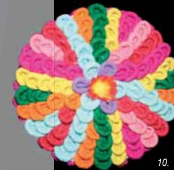
10. Διακόσμηση χριστουγεννιάτικου δένδρου, 2005, Πολωνία