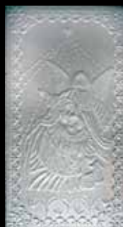
33. “Oplatek” baking mould from Zamość, Lubelskie Province, late 19th c., engraved iron

ευχές για καλή υγεία και ευτυχία στους ενοίκους. Οι νοικοκυρές τους ανταμείβουν για να εξασφαλίσουν καλή τύχη και αφθονία. Το Χριστουγεννιάτικο τραπέζι είναι μια ευκαιρία για να συγκεντρωθεί όλη η οικογένεια και να συνεορτάσει. Τα πλουμιστά Χριστόφωμα, οι διάφορου τύπου πίτες, τα Χριστικούλουρα συμπληρώνουν το εορταστικό γεύμα. Το δένδρο με τους στολισμούς και την πρασινάδα του, που συμβολίζει τη ζωή και τη βλάστηση ή το στολισμένο καϊκι (συνηθισμένο στα νησιά) φέρνουν στα σπίτια χαρά και ζεστασιά.